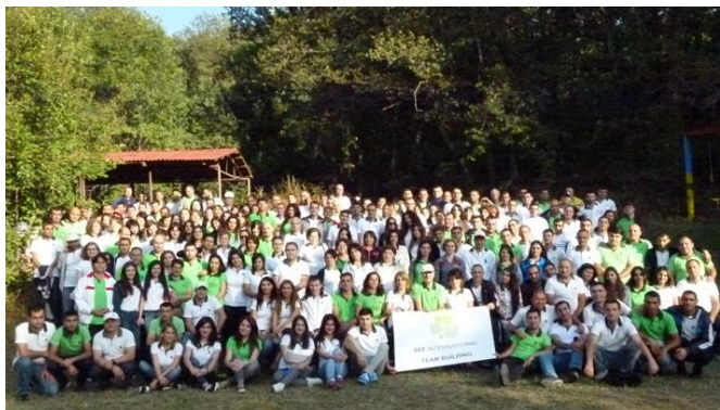
Team Building der SEF International Mitarbeiter

Der GLS Mikrofinanzfonds ist derzeit mit 61 Darlehen in 44 Instituten investiert. Somit werden knapp 20.000 Endkreditnehmer in 23 Ländern erreicht.