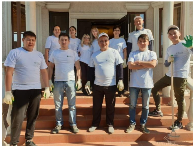
Bild: Mitarbeiter von Oxus

OXUS MCC CJSC (“OXUS”) ist ein Mikrofinanzinstitut, welches seit August 2006 durch die Nationalbank Kirgistan lizenziert und beaufsichtigt wird. Das Institut gehört zur OXUS Holding mit insgesamt drei Töchtern in Afghanistan, Kirgistan und Tadschikistan. Sie ist Teil des OXUS Developing Netzwerkes (“OXUS DN”).